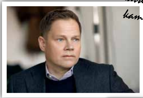
Katse enimmäkseen kameraan, välillä myös sivulle