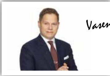
Vasen - oikea,