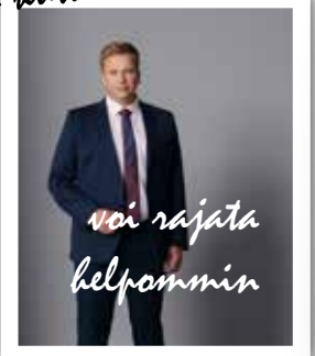
voi rajata helpommin