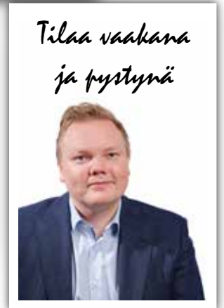
Tilaa vaakana ja pystynä