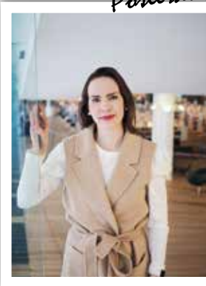
Poseraus - omilla aloissaan.