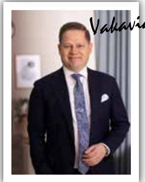
Vahavia - hymyileviä